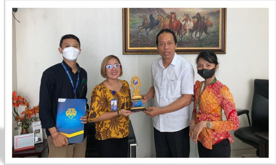
Kerjasama SDM Kerjasama On the Job Training (OJT) Siswa Alfa Prima di BPR Sadana (27 Juli 2022)