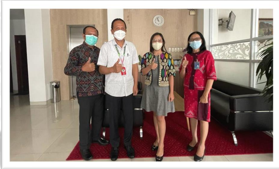
Kerjasama Finansial Pengadaan layanan pembayaran Tagihan (PPOB) Agen BNI 46 (22 Februari 2022)