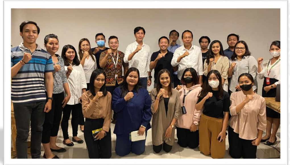
Kerjasama Finansial Visiting Mangsi Group dalam rangka Pengenalan produk BPR Sadana (Senin 24 Juli 2022)