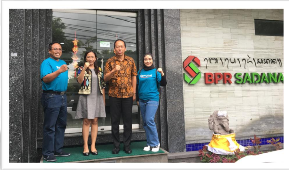
Kerjasama Finansial Pengembangan layanan Deposito Online BPR Sadana bersama Komunal.id (16 Februari 2022)